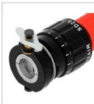
Широкое открытие зажима для лёгкого позиционирования трубы