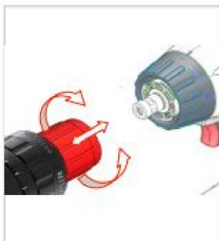
QuiXS: Замена инструментальной головки на зажимной патрон за несколько секунд