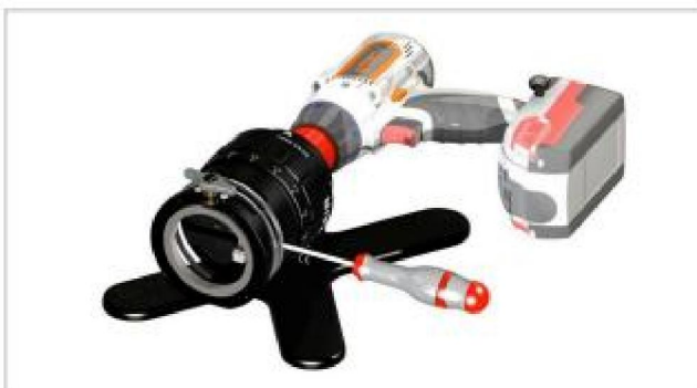
Инструмент регулируется по диаметру трубы, обработка в течение нескольких секунд