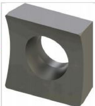
Реверсивный инструмент HSS TIALN HIGH QUALITY (две режущие кромки)