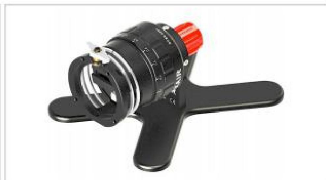
Дополнительно мы можем поставить пакет с инструментальной головкой DC65