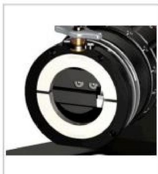
Широкое открытие зажима для лёгкого позиционирования трубы

DC65: торцовка и резка скоса кромки (дополнительно держатель инструмента) на рабочем столе и непосредственно на трубах (съёмная опора).