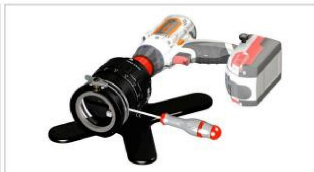
Инструмент регулируется по диаметру трубы, обработка в течение нескольких секунд